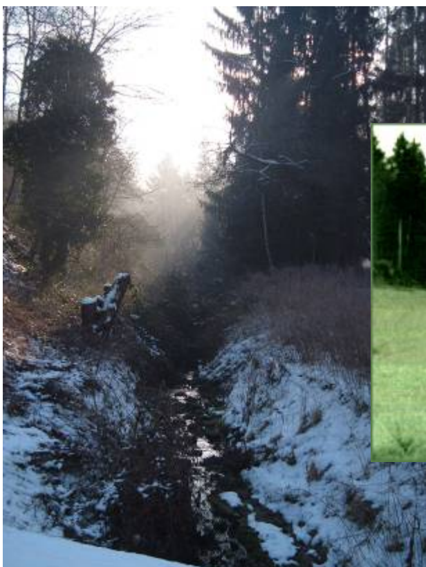
Vergleich Heute und Gestern.