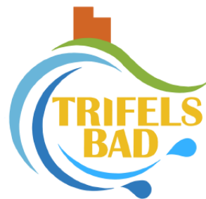
Foto: Das Trifelsbad bekommt ein neues Logo. Entworfen hat es Matthias Hoffmann aus Kirrweiler.

Redaktionsschluss der Dorfzeitung ist jeweils der 27. des Monats.